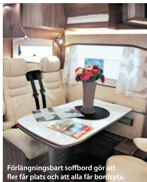
Förlängningsbart soffbord gör att fler får plats och att alla får bordsyta.

huvudända samt är utrustad med spiral- och tjock bäddmadrass av mycket hög kaliber.