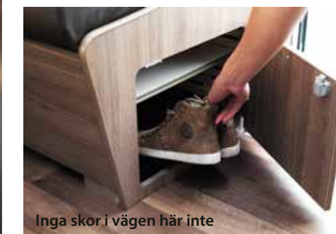
Inga skor i vägen här inte

vill jag bara uppmärksamma er om en detalj som fastnar lite extra hos mig. Den nedsänkbara taksängens underrede. Ett – den ser inte ens ut som en taksäng. Två – en mängd hyllfack är integrerade. Tre – högtalare likaså. Tänk vad man kan göra med en enda produkt om man tänker till ett varv extra. Ska bli intressant att se om konkurrenterna följer upp med något liknande på sina 2016-modeller. Till sist. Kabe Travel Master i810 QB är inte en husbil ni ska läsa om. Den måste ni bara prova!