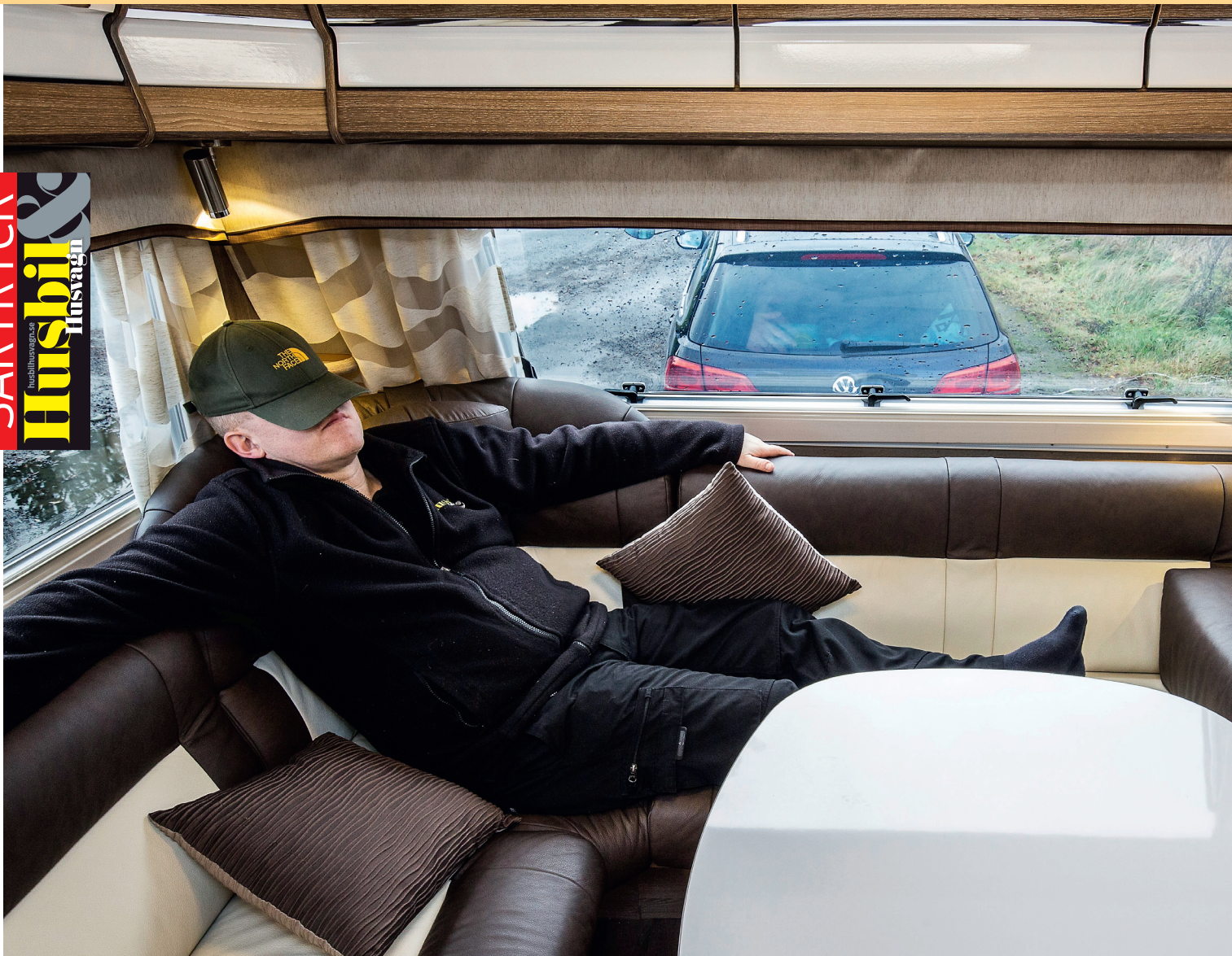
TUPLUR. Vagnens skönaste ställe är vänster hörna i den skidklädda sittgruppen. Med vanlig U-soffa finns det en till att välja på.