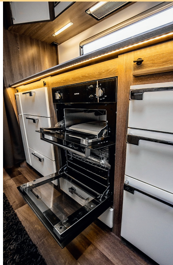
GRILLTIME. Det finns både ugn och grill som standard.