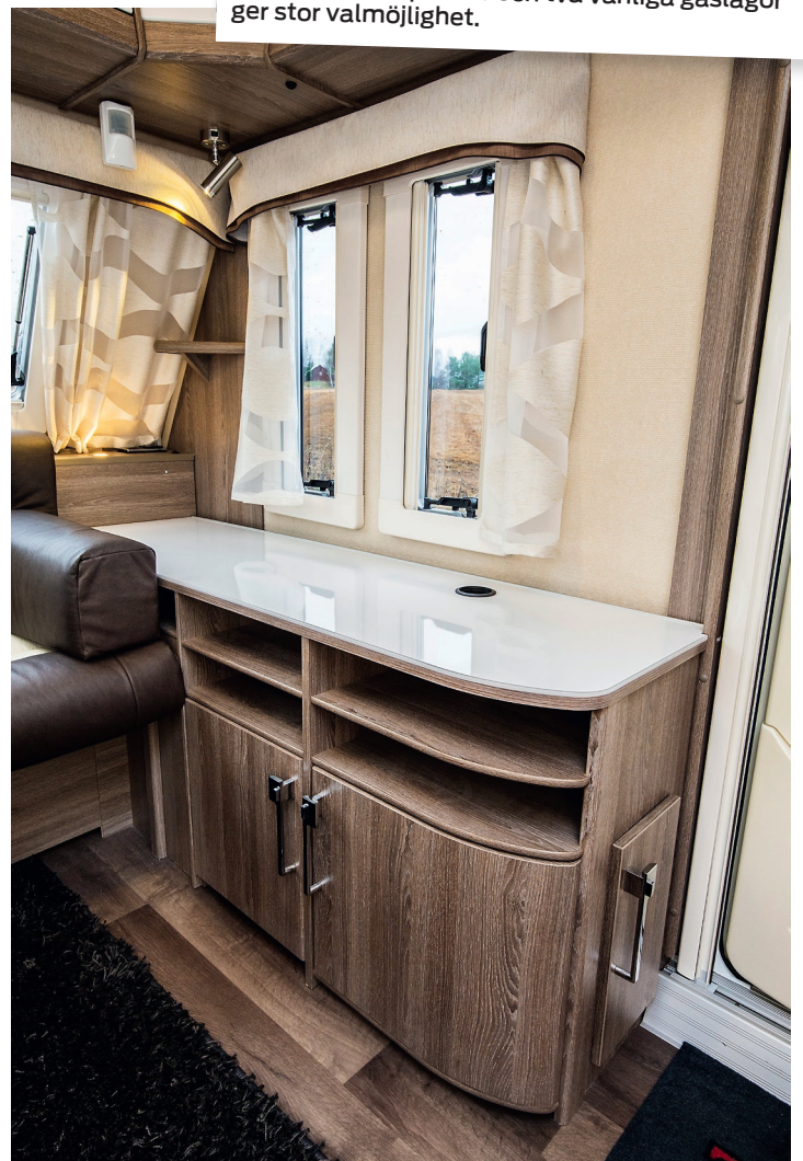
TRÅNGT. Dörrarna på skåpet går att öppna utan problem om bordet skjuts åt sidan, annars blir det trångt. Skofack finns.

Det finns ett draperi mitt i vagnen så det går att skärma av vagnens mer privata bakre del som hyser garderober, badrum och säng. Mellan garderoben och badrummet finns det i den testade vagnen ett lågt bänkskåp med fönster ovanför vilket ger en trevlig atmosfär. Det finns även en annan planlösning för 600 XL som istället har ytterligare en garderob här. I badrummet finns det inget fönster vilket passar många bra, är det någonstans det kan hoppas över är det här. Hela golvet är ett duschkar med golvbrunn och ett duschraperi finns för att skydda inredningen från stänk. Handfatet är infällt i en bänkskiva som erbjuder en stor avställningsyta och kranen fungerar även som duschmunstycke för det har en slang som ligger ringlad som en orm i skåpet under handfatet. Toaletten har