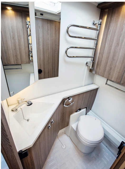
VARMT. I badrummet finns bland mycket annat en timerstyrd handduktork och taklucka.