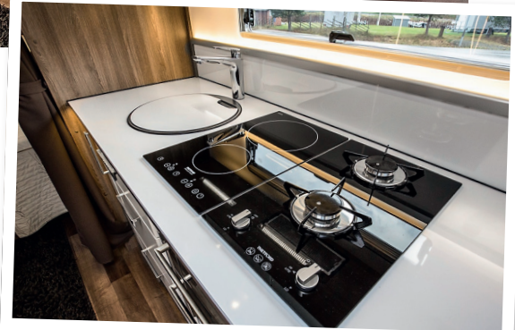
ELGAS. Två elplattor och två vanliga gaslågorna ger stor valmöjlighet.