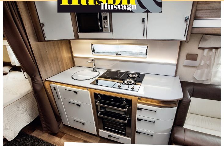
BRA. Köket är välutrustat och arbetsytorna finns det gott om. De vita luckorna är ett av få tillval i den testade vagnen.