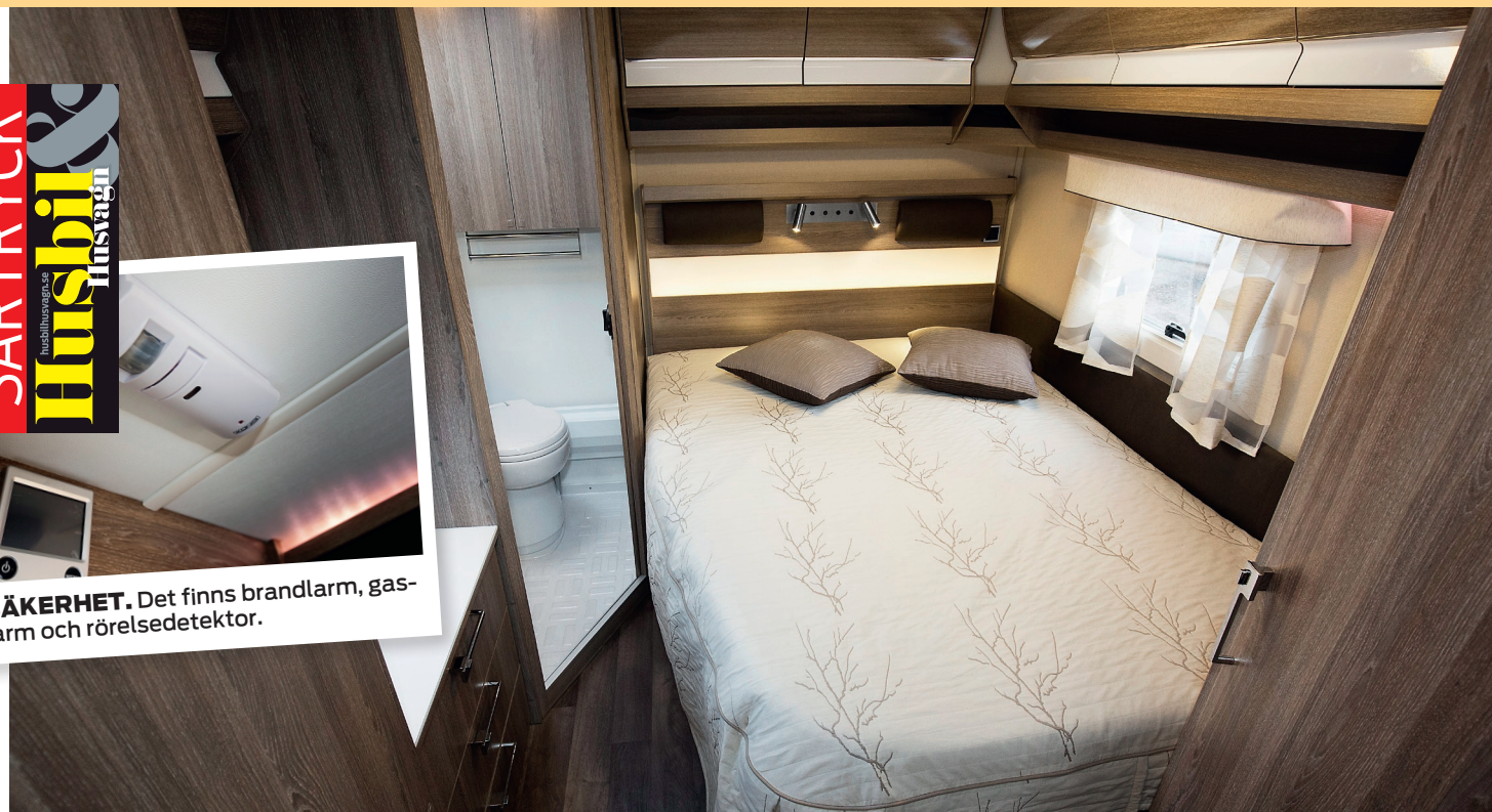
SOVRUM. Förutsättningarna är goda för att sova gott här. Däremot smalnar sängen av lite väl tidigt i fotänden vilket är synd.

SÄKERHET. Det finns brandlarm, gaslarm och rörelsedetektor.