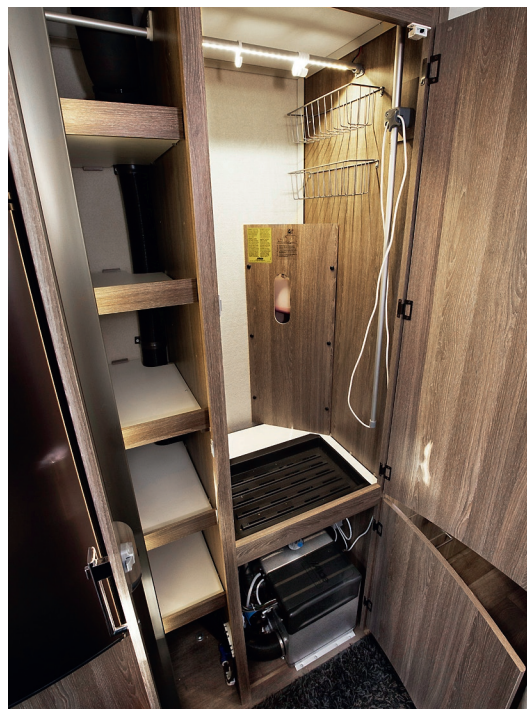
TORRT. En av garderoberna fungerar som torkskåp och bredvid finns bra stuvutrymme.

Det andra tillvalet finns i köket där vita luckor pryder skåpen istället för den nya mörka trädekoren Shannon Oak som finns i vagnen och är standard i serierna Royal-, Imperial och Hacienda. Spisen är svart vilket ger ett fräscht intryck tillsammans med den blanka glasliknande bänkskivan och den belysta plexiglasväggen som inramar ett stort köksfönster. Spisen har två gaslågor och två induktionsplattor vilket kan ses som det bästa av två världar; Elplattor om det finns ström och gaslågor om fricamping står på menyn. I underskåpen hittar vi både apotekarskåp, sopkorgar och utdragbar skärbräda. I köket finns även en köksfläkt, inbyggnadsugn med grill, micro och gott om arbetsyta, så det är utan tvekan fullutrustat.