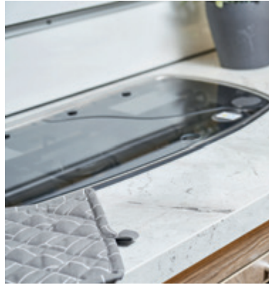
Laminat "marmor" i arbetsbänk.