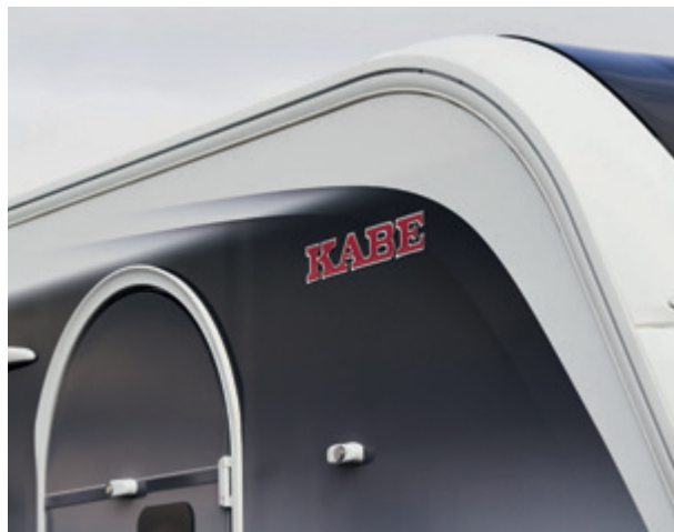
Ny dekor på en släta väggplåten med stilrena linjer och sobra mörka toner.

KABEs unika värden ingår oavsett vilken modell som passar bäst för dig och din familj.