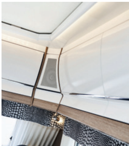
Överskåpsluckor, kromlist, högblank Shannon Oak.