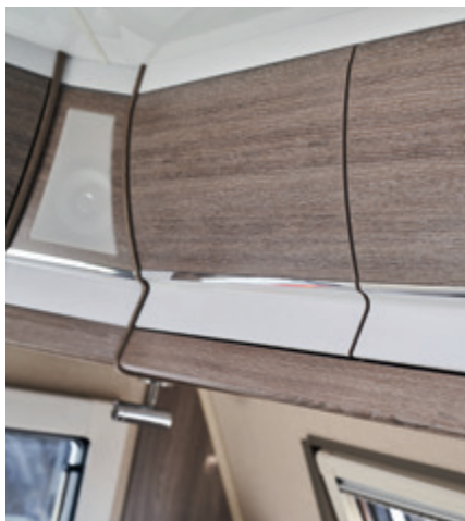
Överskåpsluckor, kromlist, Shannon Oak.