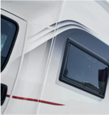
Uppdaterad design på väggplåt