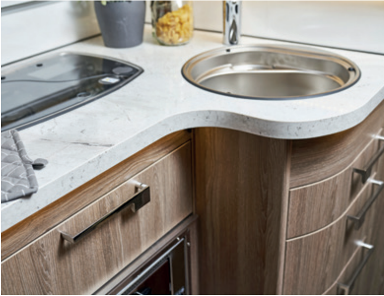
Infällda luckor och lådor.