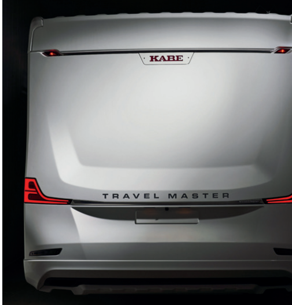
Ny bakände på halvintegrerade Royal-husbilar

i KABEs Smart D-panel. Temperaturen i kyl och köldfack kontrolleras automatiskt med hjälp av ett sensorsystem, som också bidrar till låg energiförbrukning, förklarar Mikael.