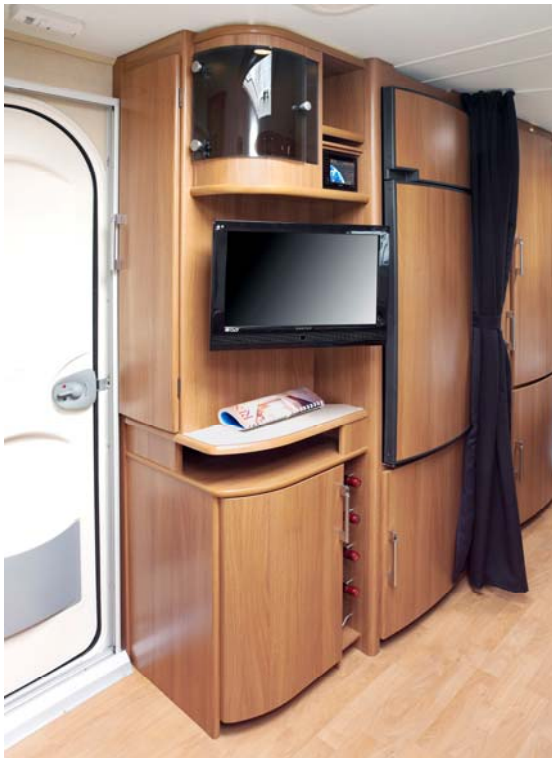
Garderob med plats för ytterkläderna finns nu strax innanför dörren. Ett exklusivt mediapaket med pekskärm är standard i Royal- och Hacienda-serierna – tillval i Ädelstenmodellerna.