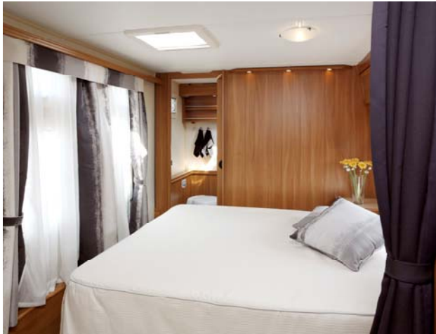
Royal Hacienda 880 D-TDL har inbjudande, tvärställd dubbelsäng med hygienavdelningen strax intill.