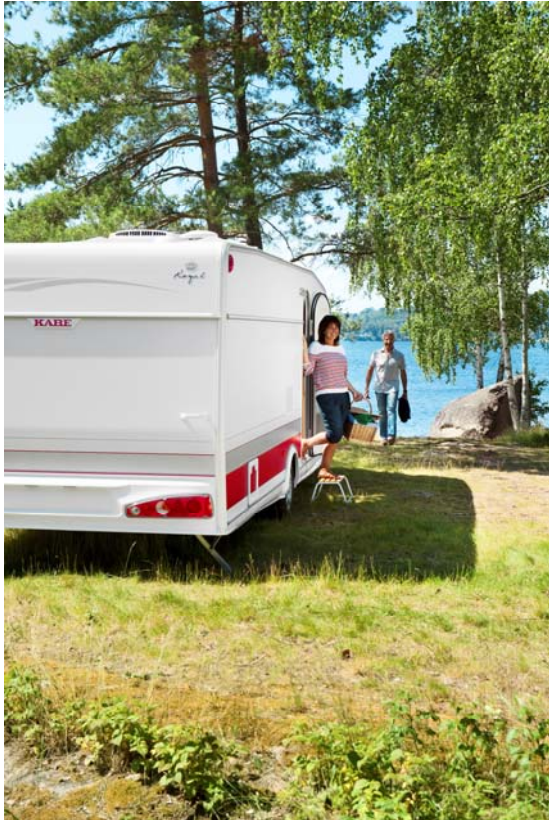
Bakljusramp med de nya lamporna som går runt hörnet hör till de mest synliga utvändiga förändringarna.