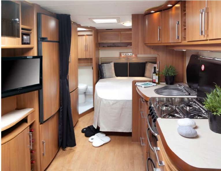
Elegant sänggavel vid sängarna.