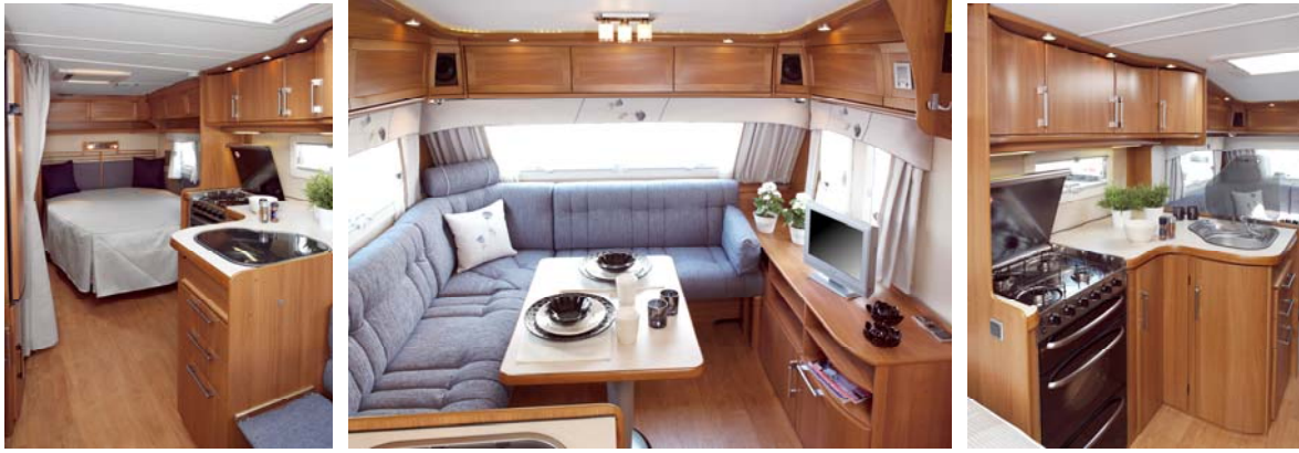
Nya Royal 560 LXL får bland annat vinkelkök.