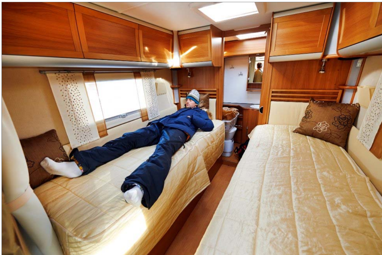
GOD NATT: Petter Northug gikk rett til sengs da han så sin nye «turnebuss».