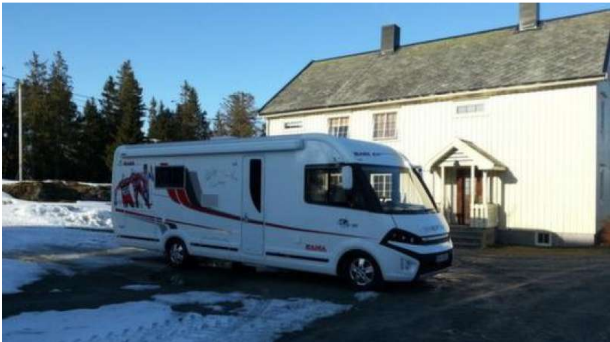
HJEMME: Så langt har campingbilen stort sett vært parkert på gårdsplassen hjemme i Mosvik.