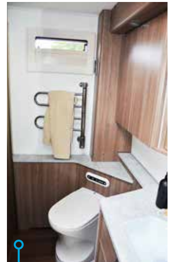
Öppningbart fönster och handdukstork vid toan.