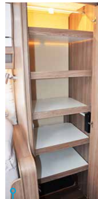
Bra med utrymme i linneskåpet, det gillas av många.