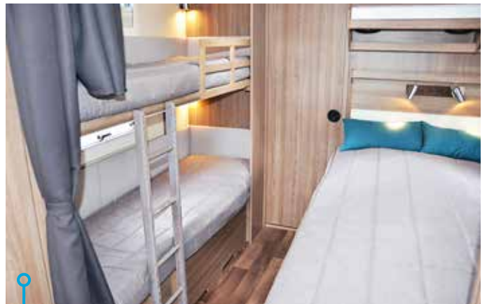
I Royal 780 TDL FK KS har barnen sin våningssäng bredvid de vuxnas franska bädd.

vill känna närhet och trygghet nattetid.