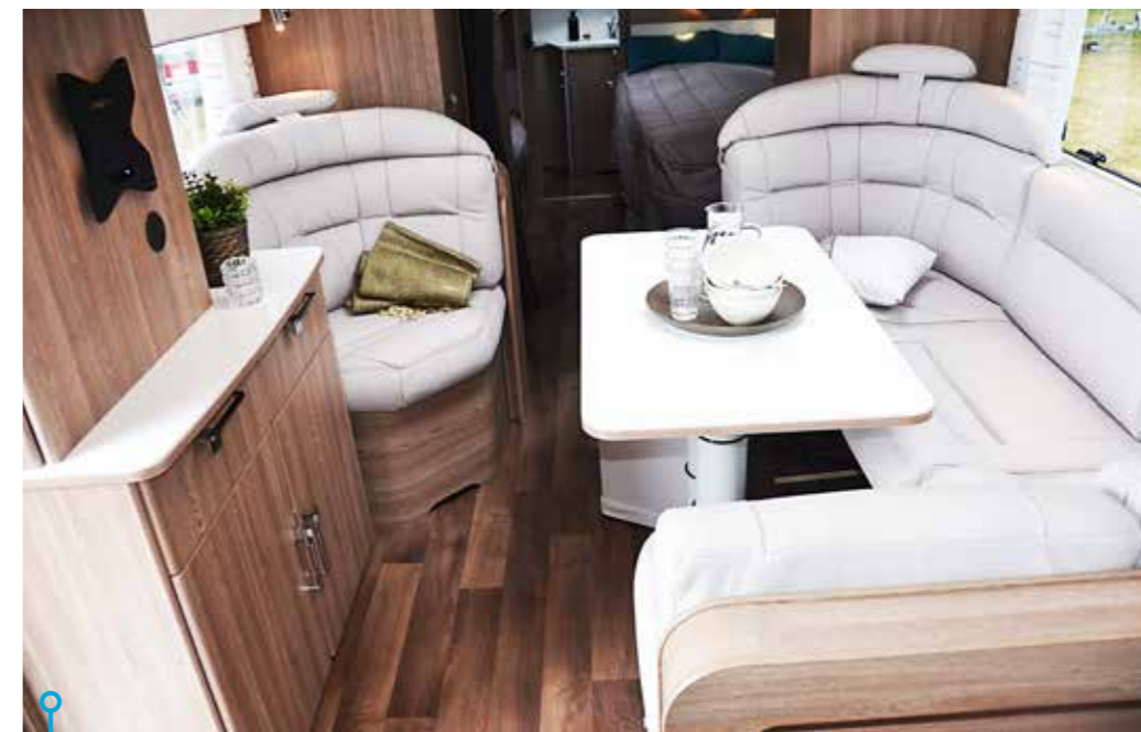
Komforten i sittgruppen är något utöver det vanliga. Bara en sådan sak som egen fåtölj, det doftar lyx lång väg.