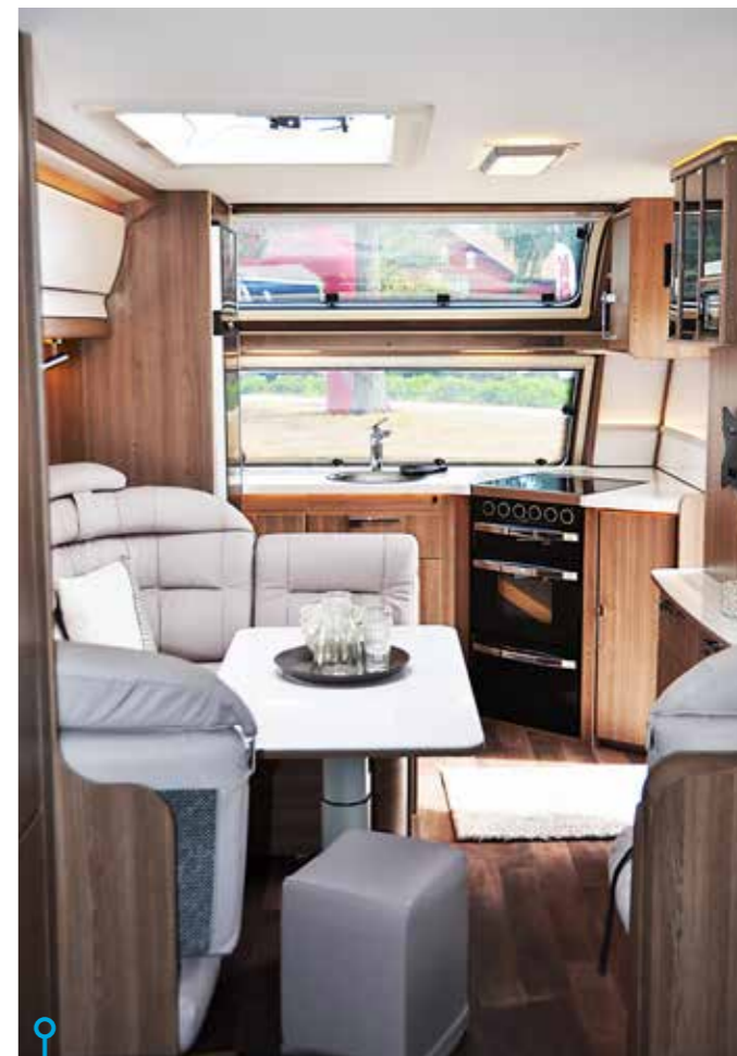
Frontköket har blivit en succé i Kabes husvagnar och finns nu i fler modeller än tidigare.

KOMFORT KAN definieras på olika vis. Hos Kabe är det massvis med användarvänliga komponenter som kombineras med smarta byggkonstruktioner, vilket framkallar känsla av trivsamhet och god komfort utan att vi kan se det. Främst