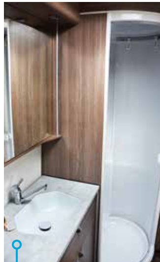
Separat duschkabin allra längst bak i husvagnen.

DET RÖR SIG OM en barnkamarvagn, emellertid inte med en planlösning där barnen får eget rum. Ty den franska sängen (har 12 centimeters spiral- och sex centimeters bäddmadrass) och våningssängen är grannar med varandra och allra längst bak finns ett vagnsbrett hygienutrymme med separat toalett- och duschavdelning. Bör vara för barn som