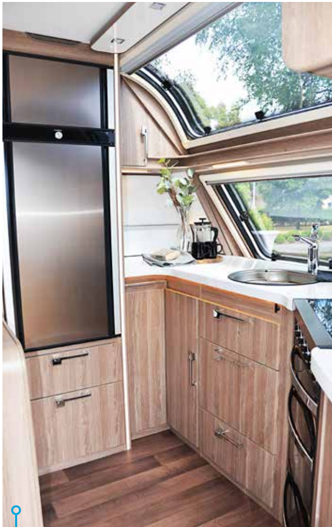
Ett kök i världsklass med fyrlådig spis inklusive ugn och grill samt kyl/frys som kan öppnas från båda håll.

handlar det om isolering (Eco-prim 36 mm golv/väggar/tak), ventilation och värmesystem där allt är av högsta kvalitet utan kompromiss på en enda punkt. Synlig komfort är givetvis bra det med. Ett exempel är sittgruppen där det finns både soffa och fåtölj. Här pratar vi femstjärnig resortkänsla.