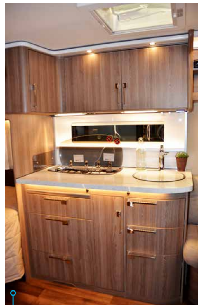
Praktiskt, rymlig och hög klass. Ett kök som kommer att älskas av många husvagnsentusiaster.

OM VI LÄMNAR historien bakom oss och blickar mot nutid visar det sig att Safir är en ganska liten del, med endast två olika modeller, av Kabes breda husvagnssortiment: 600 GLE (som finns i fyra olika planlösningar)