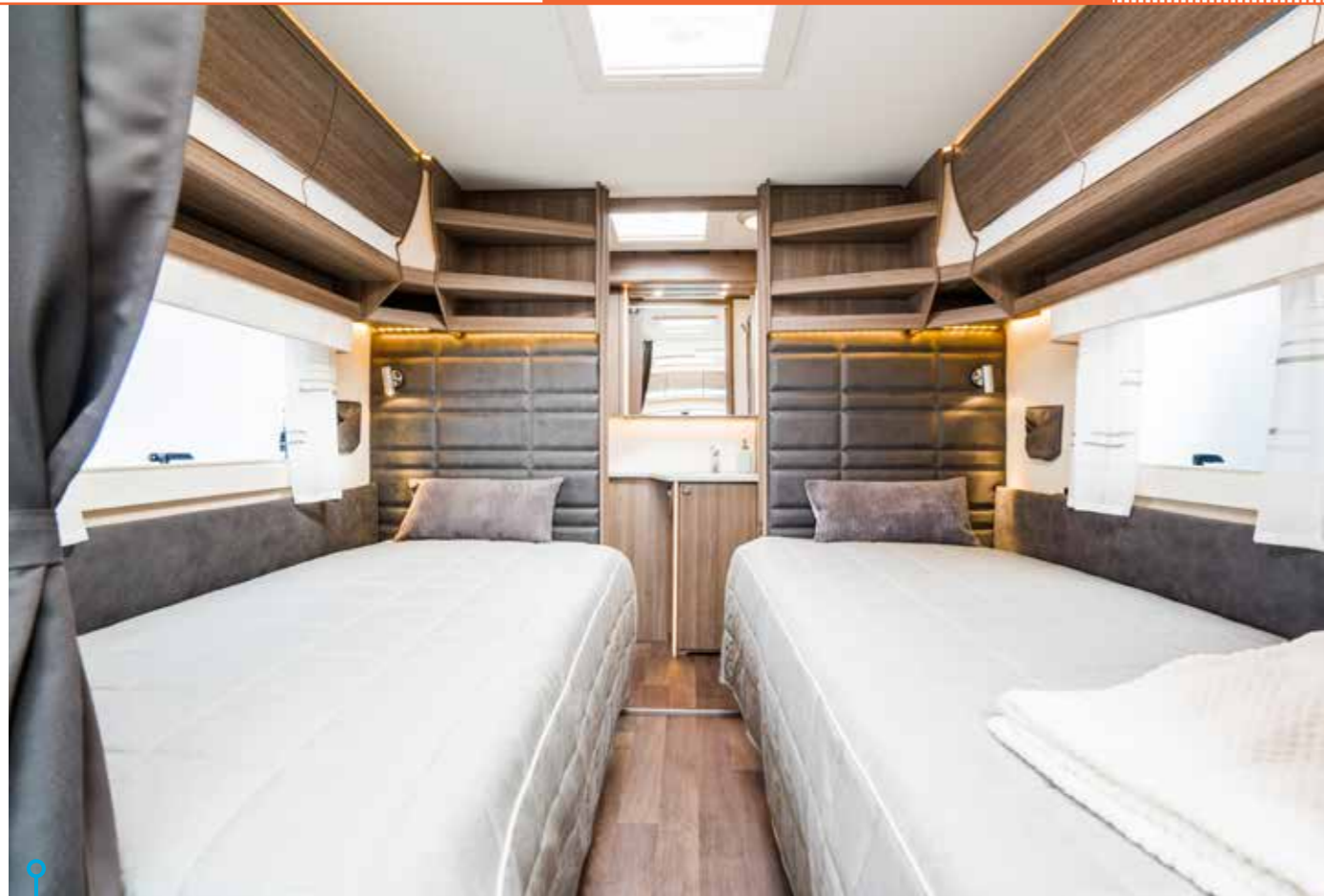
Långbäddar är populärt. I en så kallad standardvagn är bäddarna en decimeter smalare än i den testade KS.