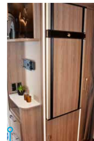
Hallmöbeln med bland annat vitrinskåp och tv-plats.