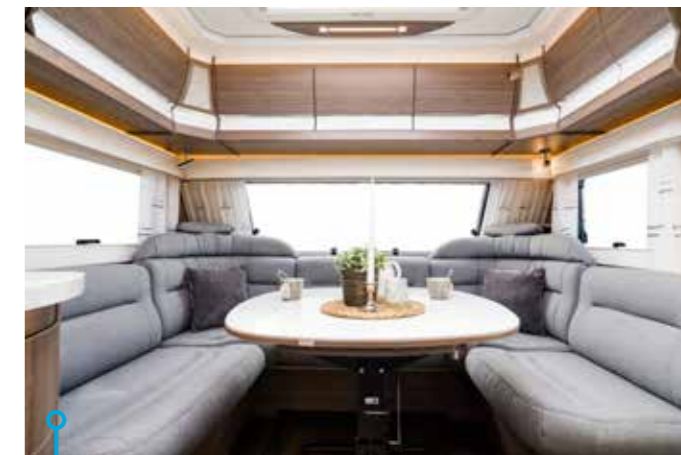
En redan förnämlig sittgrupp blev ännu bättre när nackstöd kom till i båda hörnen.

Närmast kunglig sittgrupp, ett storstilat kök med utdragbart apoteksskåp och fläkt, separat duschkabin samt garderob (inkluderat hyllor) i hygienutrymmet är andra ting som håller exakt vad en Kabevagn lovar – högsta möjliga boendekvalitet. Avslutningsvis