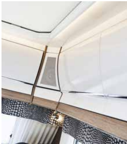
Överskåpsluckor, vita högblanka. (Royal fram. Tillval Imperial fram.)