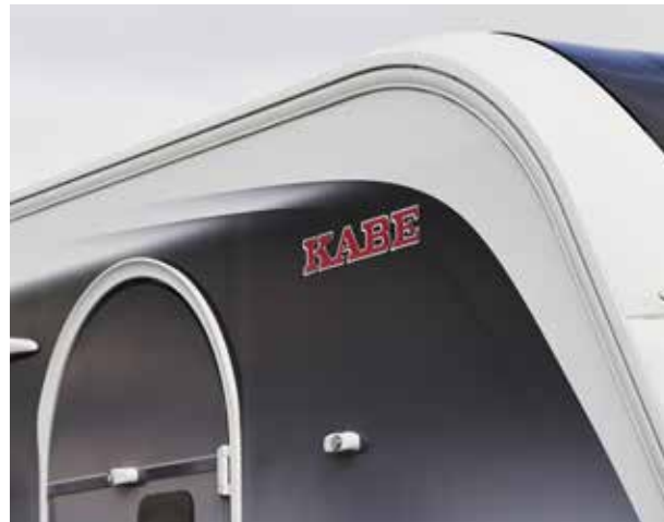
Ny dekor på den släta väggplåten med stilrena linjer och sobra mörka toner.

KABEs unika värden ingår oavsett vilken modell som passar bäst för dig och din familj.