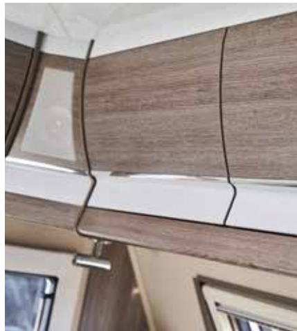
Överskåpsluckor, kromlist, Shannon Oak. (Ädelsten fram/bak. Royal bak. Tillval Royal fram). Högblanka (Imperial fram/bak).