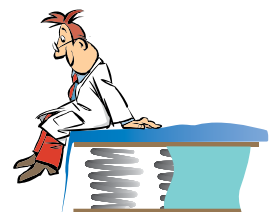
Spiralmadrasser och tjocka bäddmadrasser garanterat god nattsömn. Sängar med ställbar huvudgärd gör sängläsning extra bekväm.

Utrustningslistan kan göras hur lång som helst och för att vara riktigt säkra på att du får all information, rekommenderar vi dig att besöka någon av våra kunniga återförsäljare. Kliv in i en KABE för att uppleva känslan! Studera planlösningar och titta på detaljer! Få husbilar och husvagnar kan matcha konstruktionen och utrustningen som är standard hos KABE. Innan du jämför priser: Ta reda på vad som faktiskt ingår!