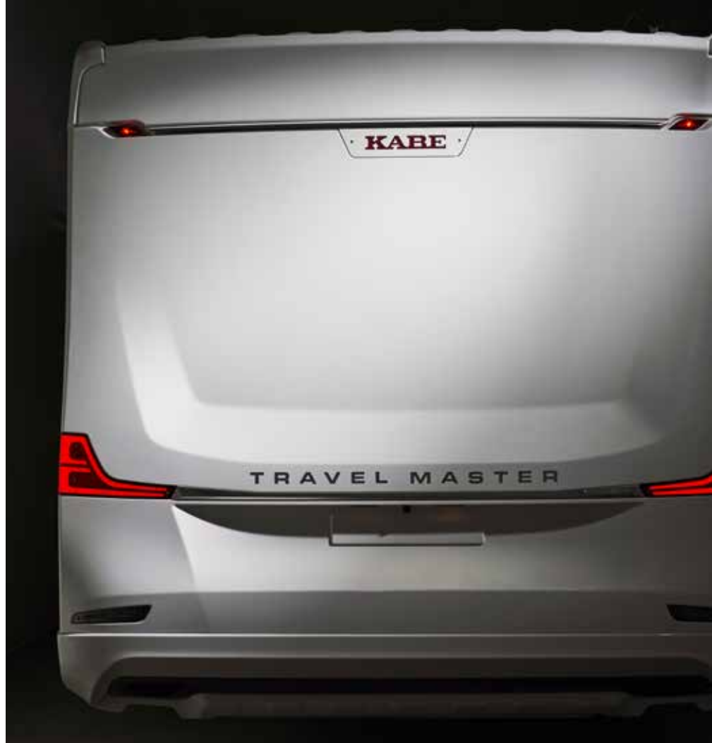
Ny bakgavel på halvintegrerade Royal-husbilar

i KABEs Smart D-panel. Temperaturen i kyl och köldfack kontrolleras automatiskt med hjälp av ett sensorsystem, som också bidrar till låg energiförbrukning, förklarar Mikael.