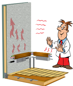
Värmen från radiatorerna sprids upp utefter väggarna. Innerplåten i väggarna fördelar värmen ut över hela väggen.

ALDEs värmepanna Compact 3020 är standard i alla våra modeller. Värmesystemet har 3 kW elpatron, 12V