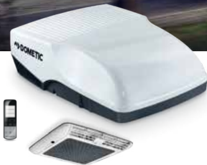
DOMETIC FRESHJET 2200